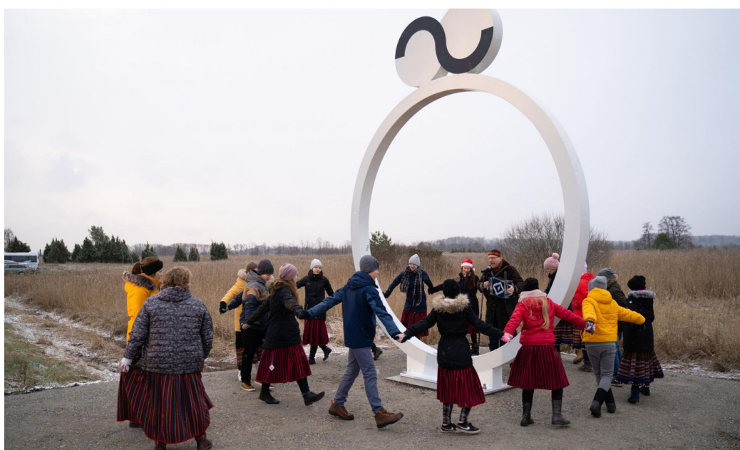
Õ- ja õ-hääliku piir Saaremaal.