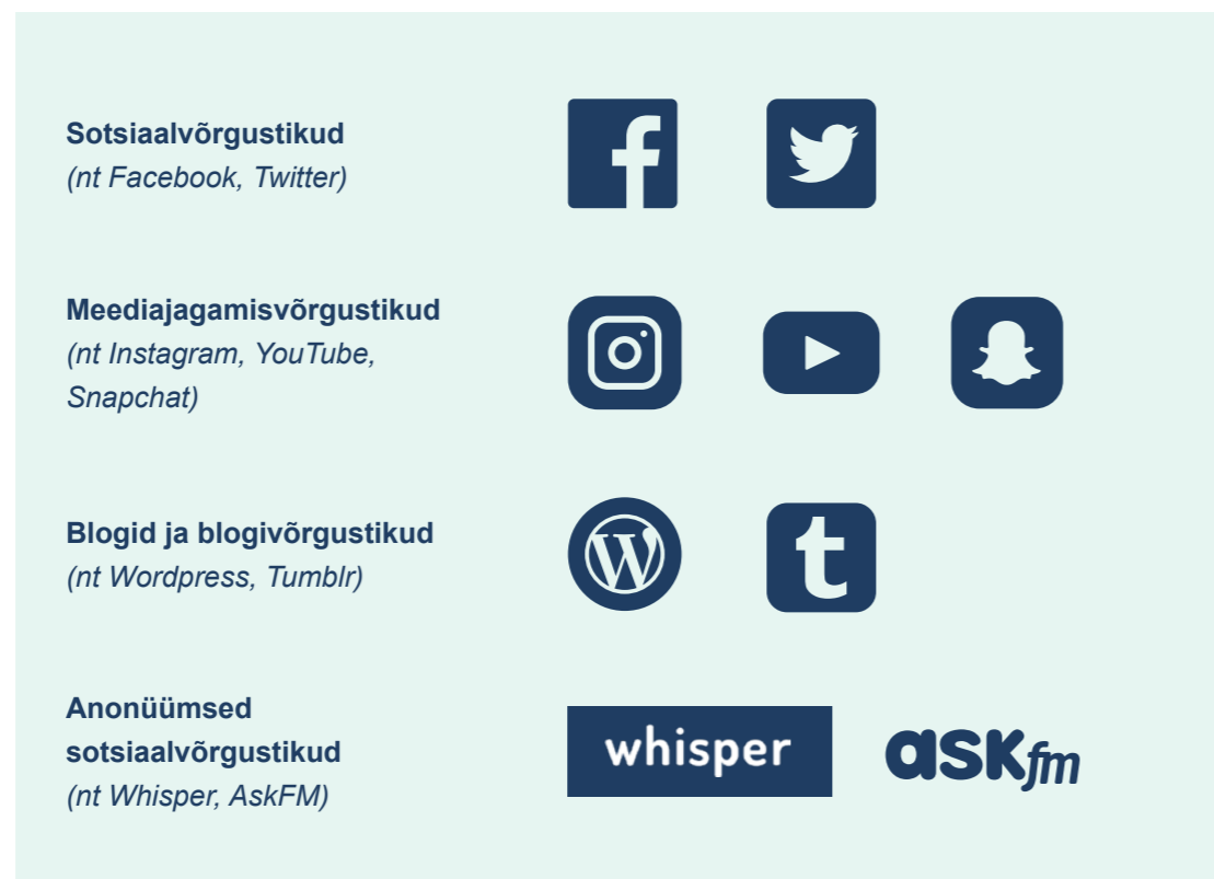
Joonis 4. Mõned sotsiaalmeediakanalite näited

Tuleks meeles pidada, et eri veebilehtede või rakenduste populaarsust ja turuosa tuleb jälgida, kuna need võivad kiirelt ja äärmiselt suures ulatuses muutuda. Teadlikkus (professionaalsetes piirides) sellest, kuidas teie õppijad sotsiaalmeediat kasutavad, võib olla oluline osa tänapäeva haridusest.